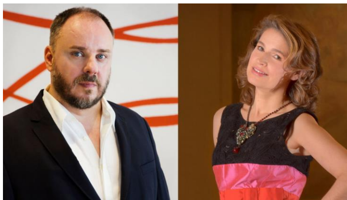
Matthias Goerne et Sophie Koch chantent Parsifal au Capitole de Toulouse