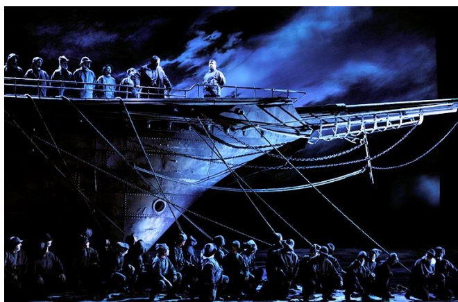
Le Vaisseau fantôme à l'honneur, cette saison (Berlin, Toronto, New York...)