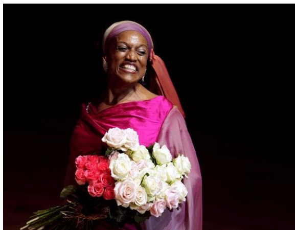
Jessye Norman en juillet 2009

Jessye Norman, soprano américaine, venait d'avoir 74 ans. Née en Géorgie, elle s'immerge, toute jeune, dans le monde du negro-spiritual, puis elle commence à étudier le chant dans plusieurs universités américaines, où elle rencontre Pierre Bernac, qui déterminera son amour pour la langue française. Elle en retiendra que l'art vocal, spécifiquement français, revêt la même importance que la musique.