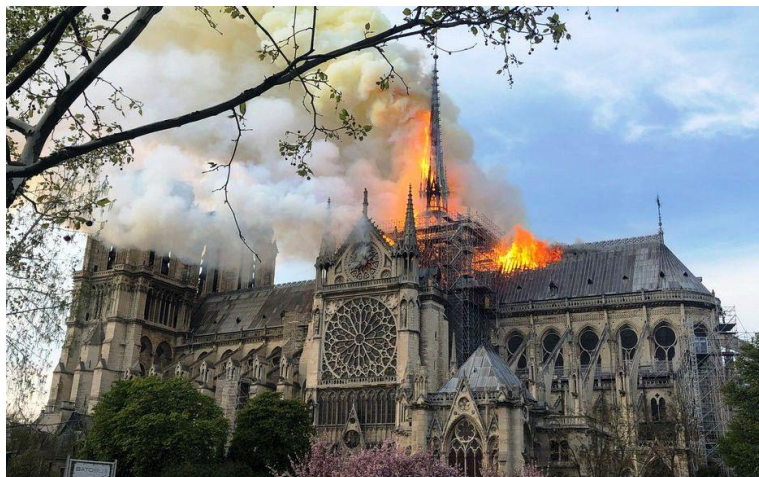
La cathédrale Notre-Dame en flammes le 15 avril 2019